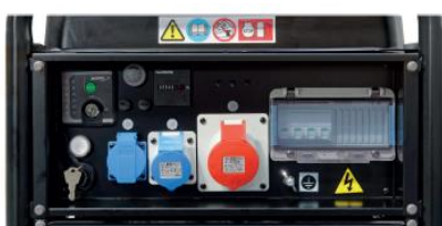
Käyttöpaneeli mallissa Technic 15000 TE AVR

Automaattisen jänniteensäätimen ansiosta jänniteenvaihtelu vain ±2% (normaaleissa aggregaateissa ±10%).